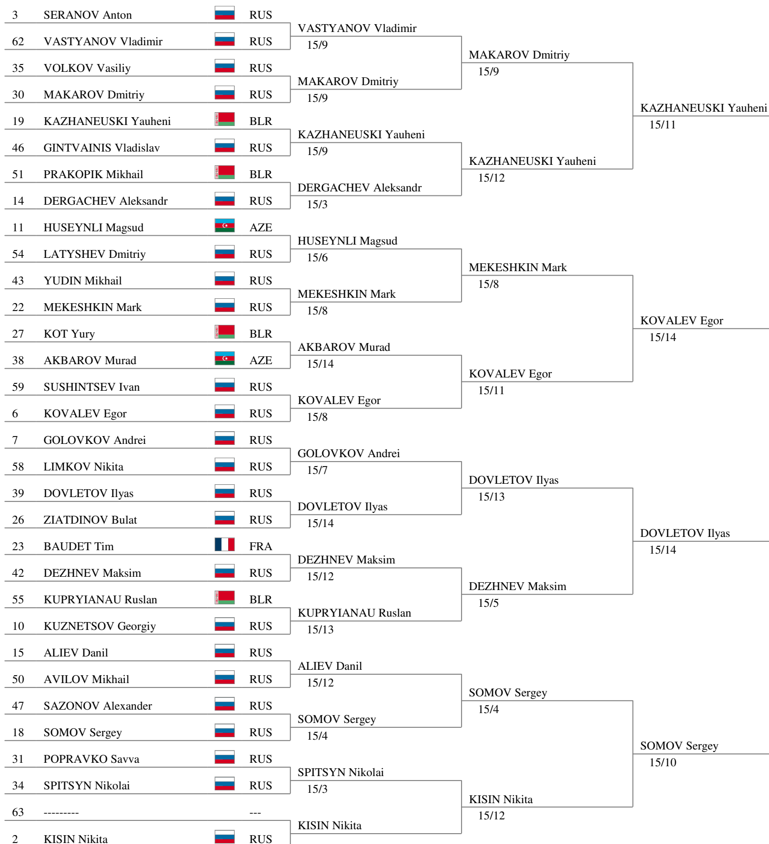
Tableau of 8