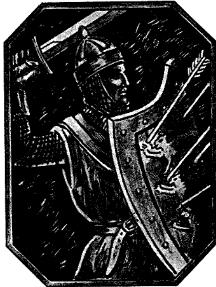
DER WACK'RE SCHWABE