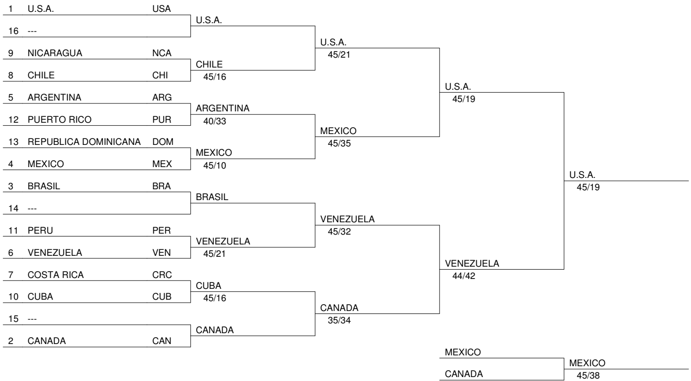
Tableau de 16