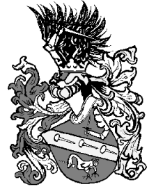
Tableau 8 Fechter